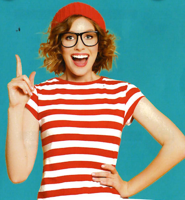
Création graphique - Mutualia Alliance Santé - Photo CANVA